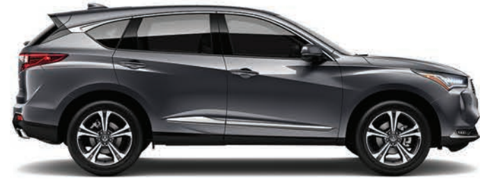
Exterior: Grafito Interior: Negro