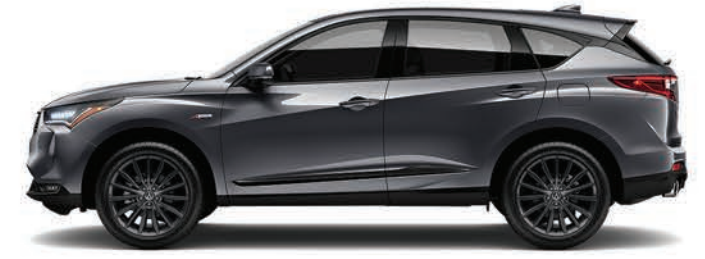
Exterior: Grafito Interior: Negro