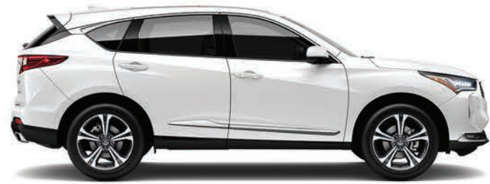
Exterior: Blanco Platino Interior: Mocha