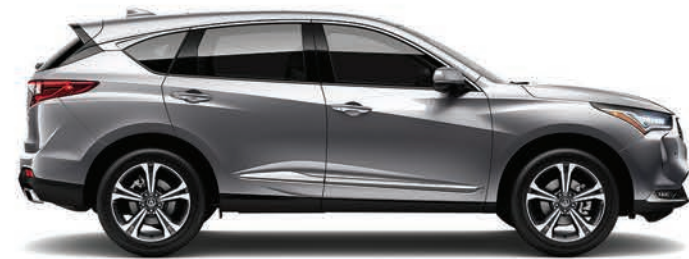
Exterior: Plata Lunar Interior: Mocha