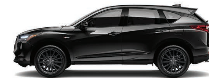
Exterior: Negro Supremo Interior: Rojo con negro