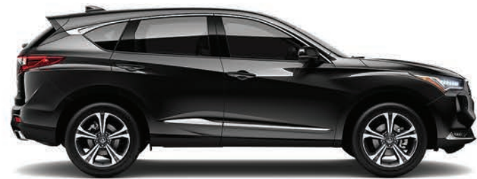
Exterior: Negro Supremo Interior: Marfil