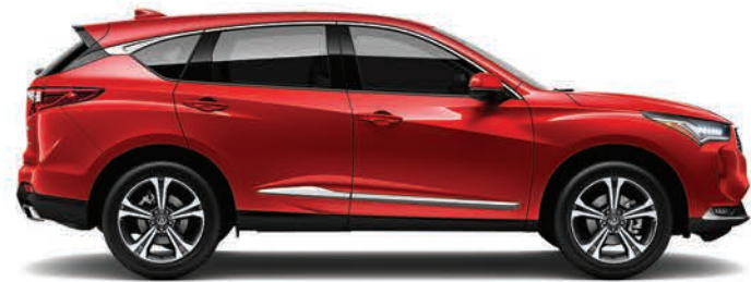
Exterior: Rojo Interior: Marfil

Los colores varían según el color y la versión elegida. Consulta disponibilidad con tu Distribuidor Acura.