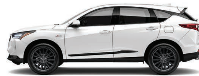
Exterior: Blanco Platino Interior: Blanco con negro