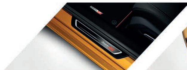
Adorno para piso de puerta iluminado con logo Type S