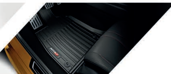
Tapetes toda temporada con logo Type S