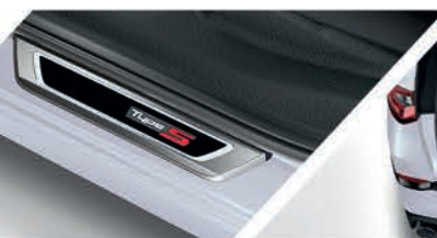
Adorno para piso de puerta iluminado con logo Type S