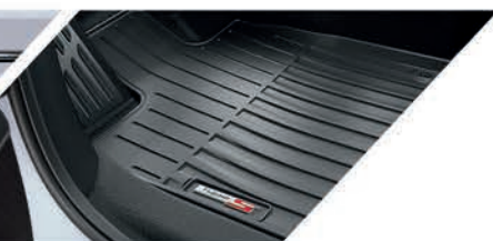
Tapetes toda temporada con logo Type S