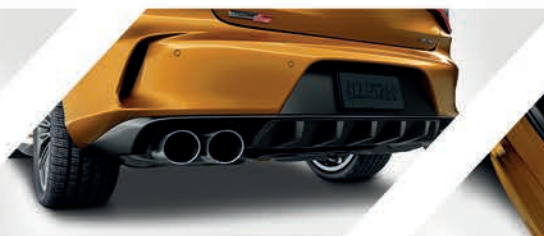
Difusor de fibra de carbono