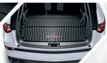
Bandeja de carga con logo Type S