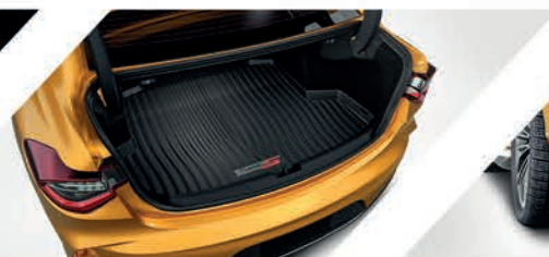
Bandeja de carga con logo Type S